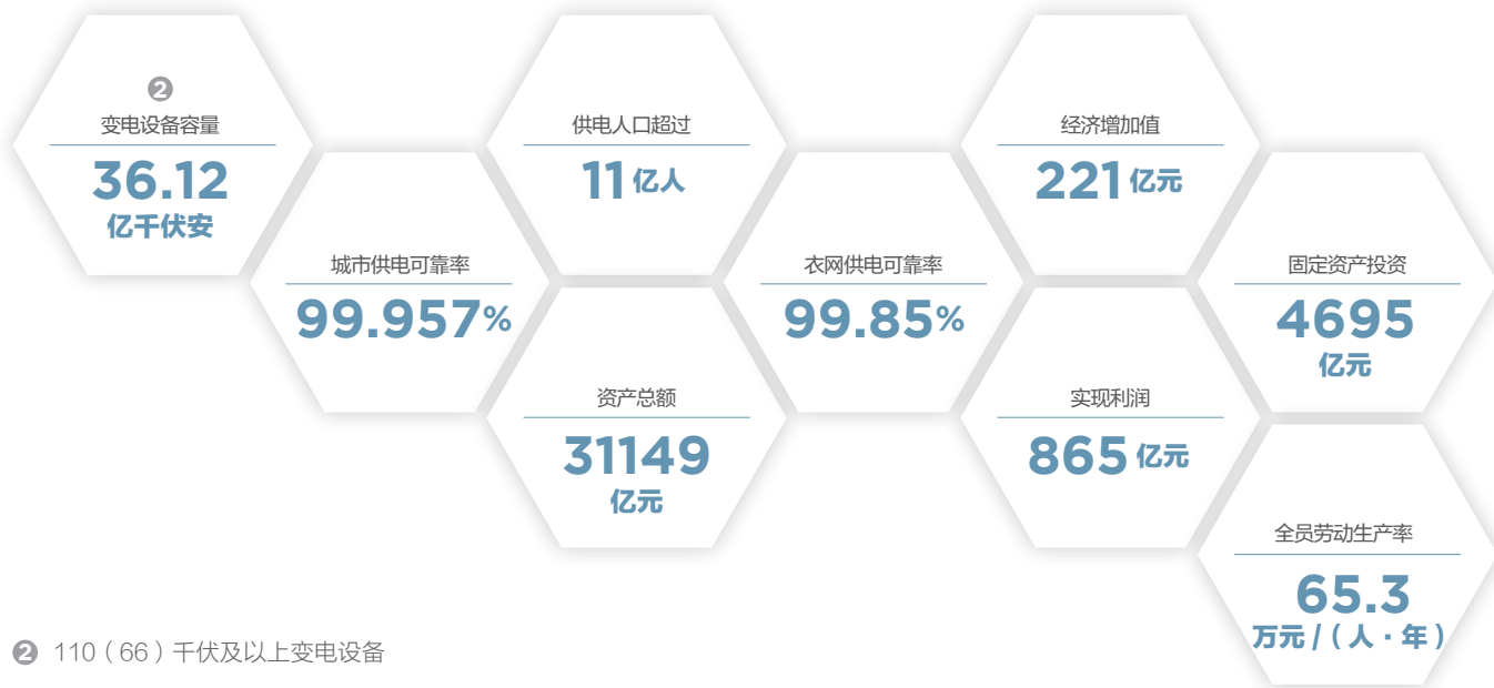
② 110（66）千伏及以上变电设备