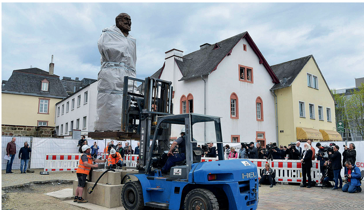
▲ 马克思诞辰 200 周年，中国赠铜像在其故乡落成。

一个纲领性文献，也是马克思、恩格斯在世界社会主义和共产主义运动史上竖立的一座不朽的丰碑。