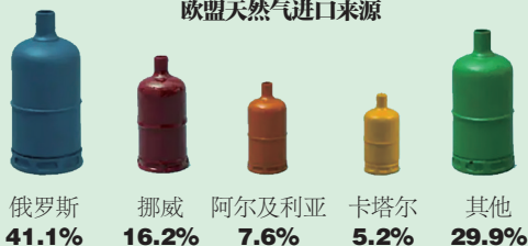
欧盟天然气进口来源

于2011年建成的“北溪1号”，近年来已处于超负荷运转状态，难以满足欧洲日益增长的天然气需求。俄罗斯与乌克兰两国之间的紧张关系影响到其他陆上天然气管道的供应安全，德国和俄罗斯两国在2015年决定修建“北溪-2”天然气管道。