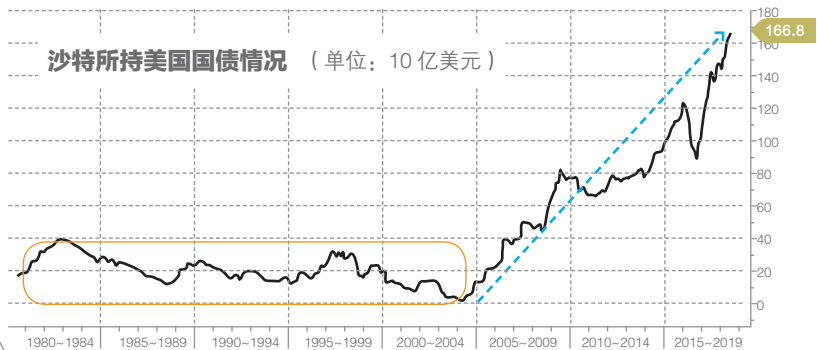
沙特所持美国国债情况 (单位: 10 亿美元)

美国财政部公布的国际资本流动报告(TIC)数据显示，截至7月底，俄罗斯一直大举减持美债，减持规模达到其持仓量的90%。当月中国也减持77亿美元，减持规模为1月以来最大。与此同时，沙特则在不断增持，与中国、俄罗斯以及日本的减持形成鲜明对比。