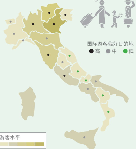
意大利各地区旅游人数水平 (2019年数据)