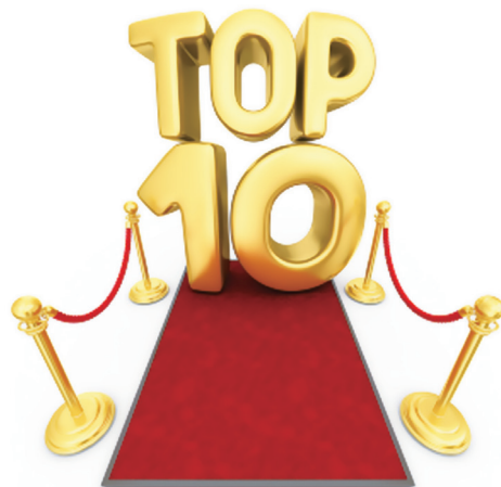
2016 年全球银行排名 TOP10