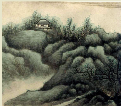
龚贤《清凉山环翠图》 手卷，纸本设色，纵30厘米、横144.5厘米 北京故宫博物院藏

在艺术传承上，龚贤受董其昌的绘画主张影响很深，继承了董巨的江南山水，不过最为引人注目的是他所形成的米氏山水变体。米氏山水指北宋米芾所创墨点山水，常称“米点”，其子米友仁也继承了这种画法。龚贤视米氏云山为神物，自言“余弱冠时见米氏云山图，惊魂动魄，殆是神物”。他学米氏墨点，但是将其转换为另一种风貌。对米氏的学习为形成他后期的“黑龚”产生了决定性的影响。这种对传统的继承并不影响龚贤最终达成自己的独特绘画风格。龚贤主张绘画应既“奇”又“安”：“位置宜安。然必奇而安，不奇无贵于安。安而不奇，庸手也；奇而不安，生手也。今有作